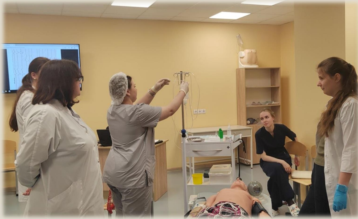
Постановка внутривенной инфузии