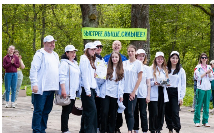
Команда Санкт-Петербургского Акушерского колледжа

День здоровья прошел бодро, весело и подарил всем хорошее настроение!