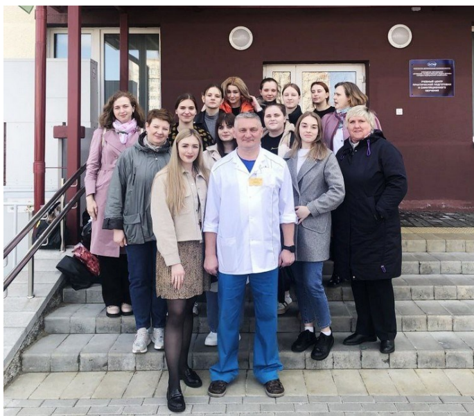
Учебный центр практической подготовки и симуляционного обучения ВГМУ

Для проведения тренинга сотрудниками Учебного центра были подготовлены различные клинические сценарии. Учащиеся работали в команде, оказывали неотложную медицинскую помощь, ставили предварительный диагноз и решали вопросы о госпитализации.