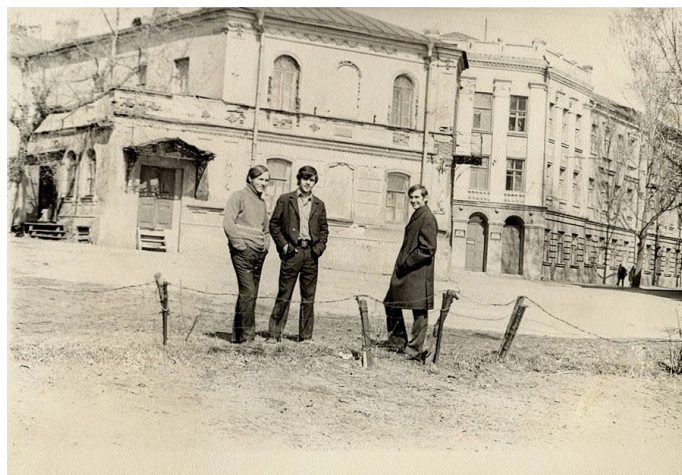
На фото: «Дом инженера Герца». 1973 год. Возможно, молодые люди, которые позируют на его фоне, учащиеся Могилевского медицинского училища.