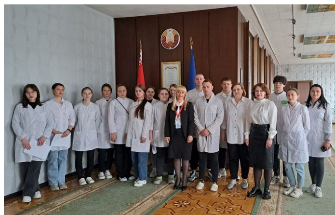
Гомельский государственный медицинский университет

В Гомельском государственном медицинском университете впервые в стране с 16 по 19 мая был реализован профорientационный проект «Выпускник медколледжа – первокурсник ГомГМУ». На четыре дня университет открыл двери для учащихся выпускных курсов Мозырского и Могилевского медицинских колледжей. Цель данного проекта – выявить наиболее талантливых, мотивированных и конкурентоспособных абитуриентов.