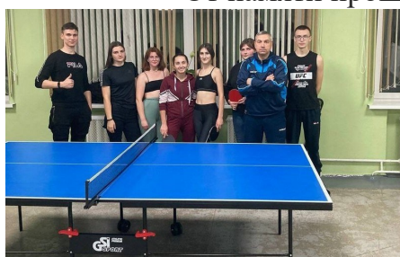
Первенство колледжа по настольному теннису