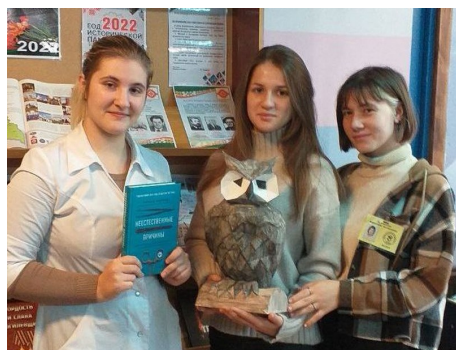
Интеллектуальная игра «Мудрая сова»