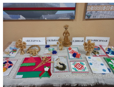
Мастер-класс «Беларусь Сильная Единая Независимая»