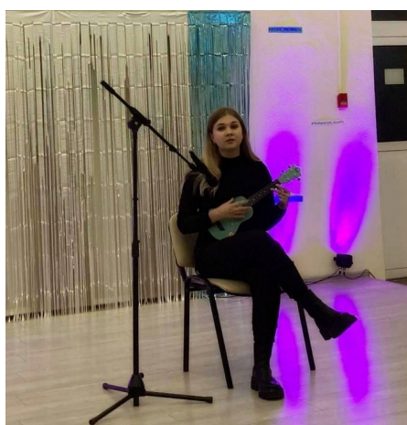
Конкурс инструменталистов «Таланты среди нас»