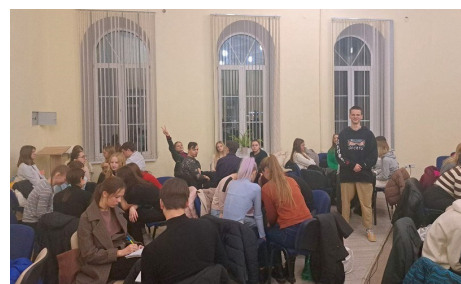
Игра «Что Где Когда»