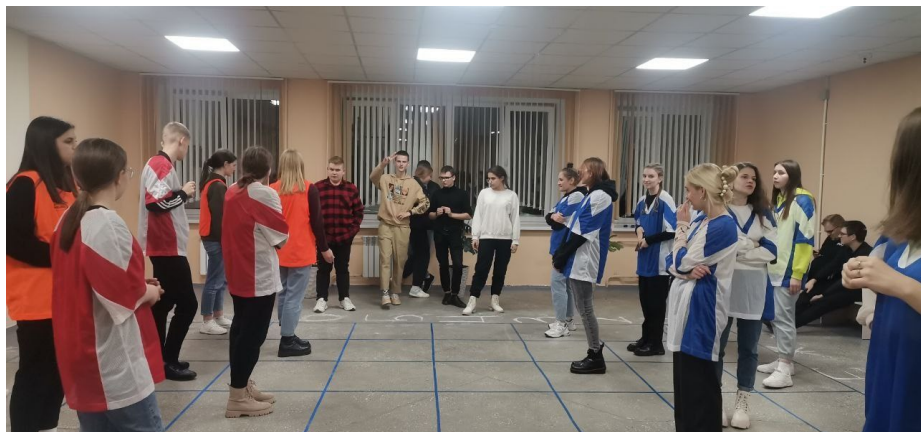
Турнир по шашкам