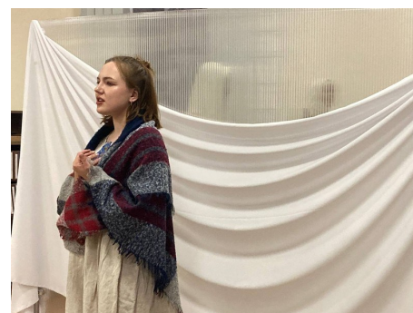
Конкурс чтецов «По строкам литературы»