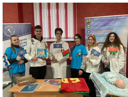
Закрытие третьего трудового семестра «Мой трудовой»