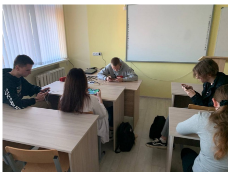
Соревнования по киберспорту