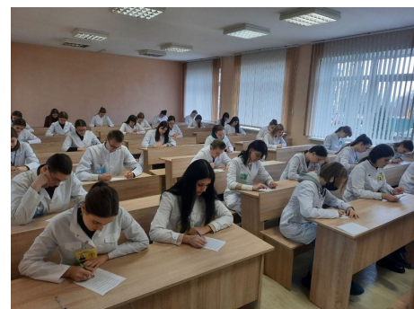
Олимпиада «Я знаю символику Беларуси»