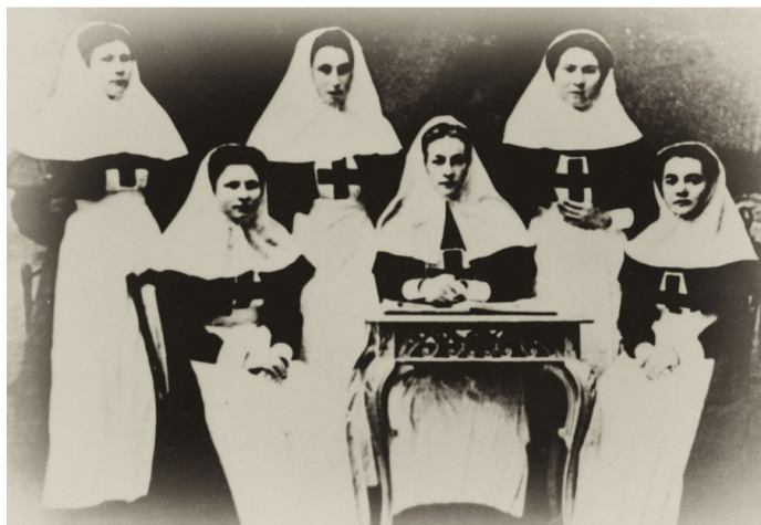
Выпускницы 1901 года