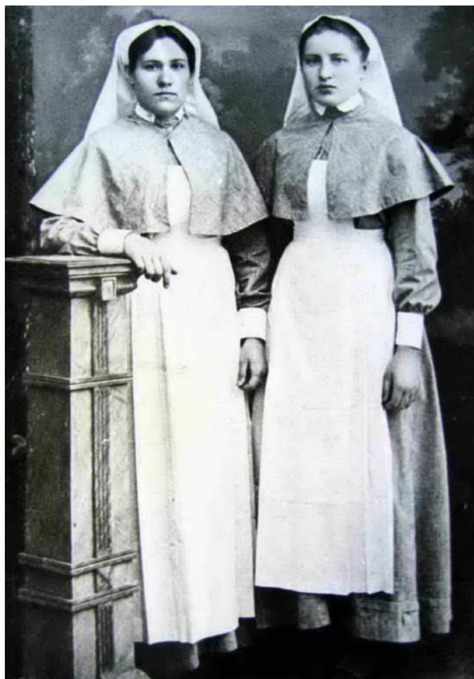
Выпускницы 1885 года

“Опыт описания Могилевской губернии” под редакцией А.С. Дембовецкого