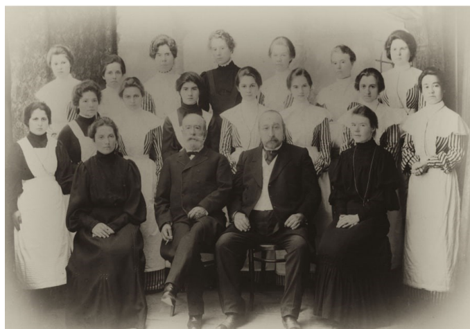
Выпуск Могилевской центральной фельдшерской школы 1906 года

Несмотря на полемику о допуске фельдшеров к самостоятельной врачебной деятельности, фельдшерское дело крепло и развивалось. В начале XX века стало понятно, что в подготовке медицинского персонала среднего звена настали перемены. Все отчетливее становилось понимание того, что помощь повивальных бабок недостаточна для сохранения здоровья всего населения. В то же время фельдшерская школа была на подъеме: выпускники получали высокие знания и их работой восхищались. И в 1913 году Могилевские губернские власти первыми объединили повивальную и фельдшерскую школы в одну, чтобы вывести учениц-акушеров на новый профессиональный